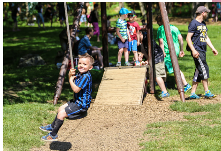
Přírodní park Prelát