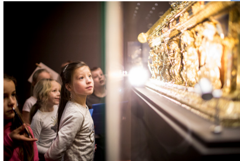
Hrad a zámek Bečov