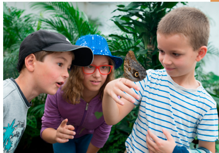
Minizoo a Motýlí dům Diana