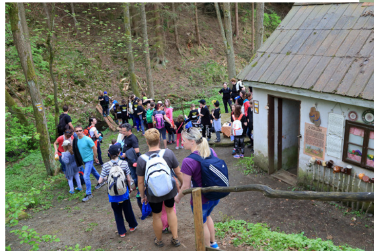
Stezka sovy Rozárky