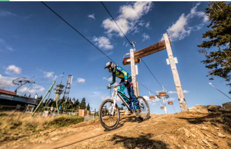
Trail Park Klínovec