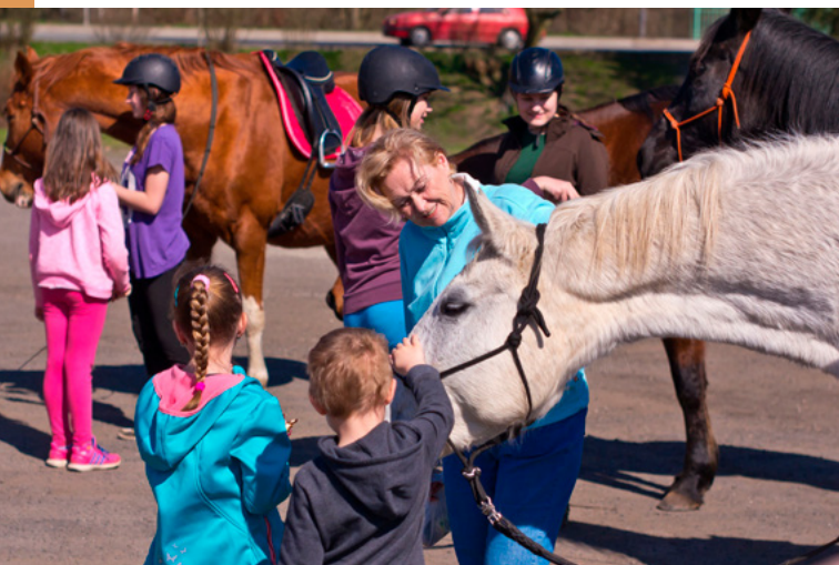
Ekologická farma Kozodoj