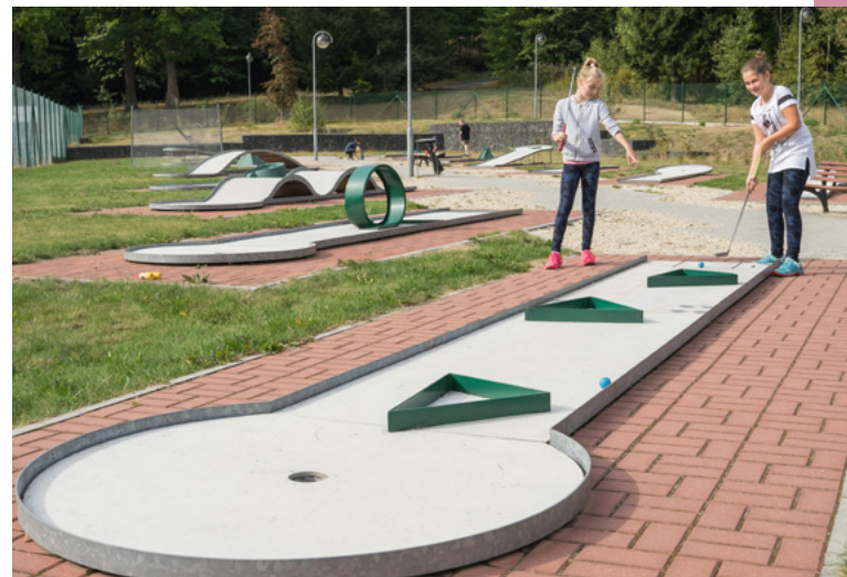
Sportovní areál – vrch Háj